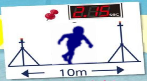
10m走(走力) タイムを光源スイッチで測定

ジャイアントフット走(調整力) 持ち手のある大きな足型(長さ54cm.発砲樹脂材)を履き、手と足をうまく使って出来るだけ早く進みます。タイムを光源スイッチで測定。