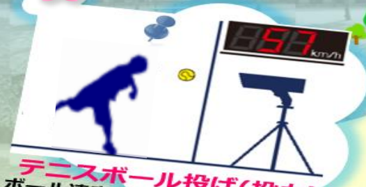
テニスボール投げ(投力) ボール速度をスピードガンで測定